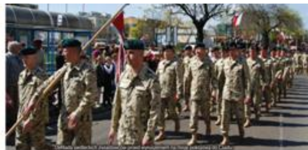
Orkiestra Dobrej Woli w Siedlcach podczas parady w dniu 1 maja 2012 roku. Orkiestra została utworzona w 2012 roku i jest jedną z wielu organizacji społecznych w Siedlcach. W 2012 roku została odrestaurowana i oddana do użytku jako siedziba Urzędu Miasta Siedlce.