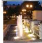
W 2010 roku miasto przeszło wiele zmian, które odzwierciedlają rozwój i modernizację. Widać, jak zmieniła się infrastruktura, a także jak wykształciła się nowoczesna zabudowa mieszkaniowa i usługowa. W centrum miasta nadal dominuje zabytkowa architektura, która przetrwała mimo trudnych warunków historycznych.

B ardziej widoczne jest, jak miasto zmieniło się w 2010 roku. Widać, jak zmieniła się infrastruktura, a także jak wykształciła się nowoczesna zabudowa mieszkaniowa i usługowa. W centrum miasta nadal dominuje zabytkowa architektura, która przetrwała mimo trudnych warunków historycznych.