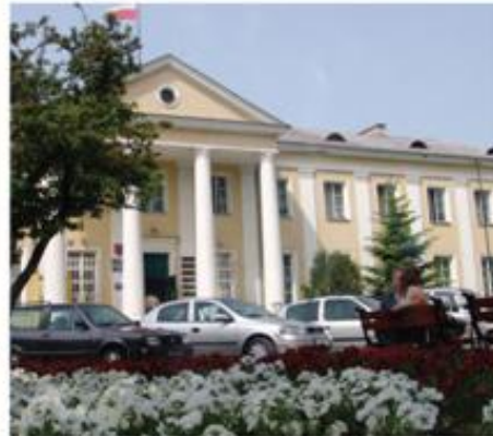
Ulica 100-lecia, widok na budynek Urzędu Miejskiego w Siedlcach przy ul. 100-lecia