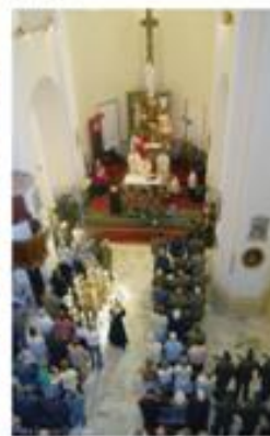
Wnętrze kościoła parafialnego pw. Ducha Świętego.